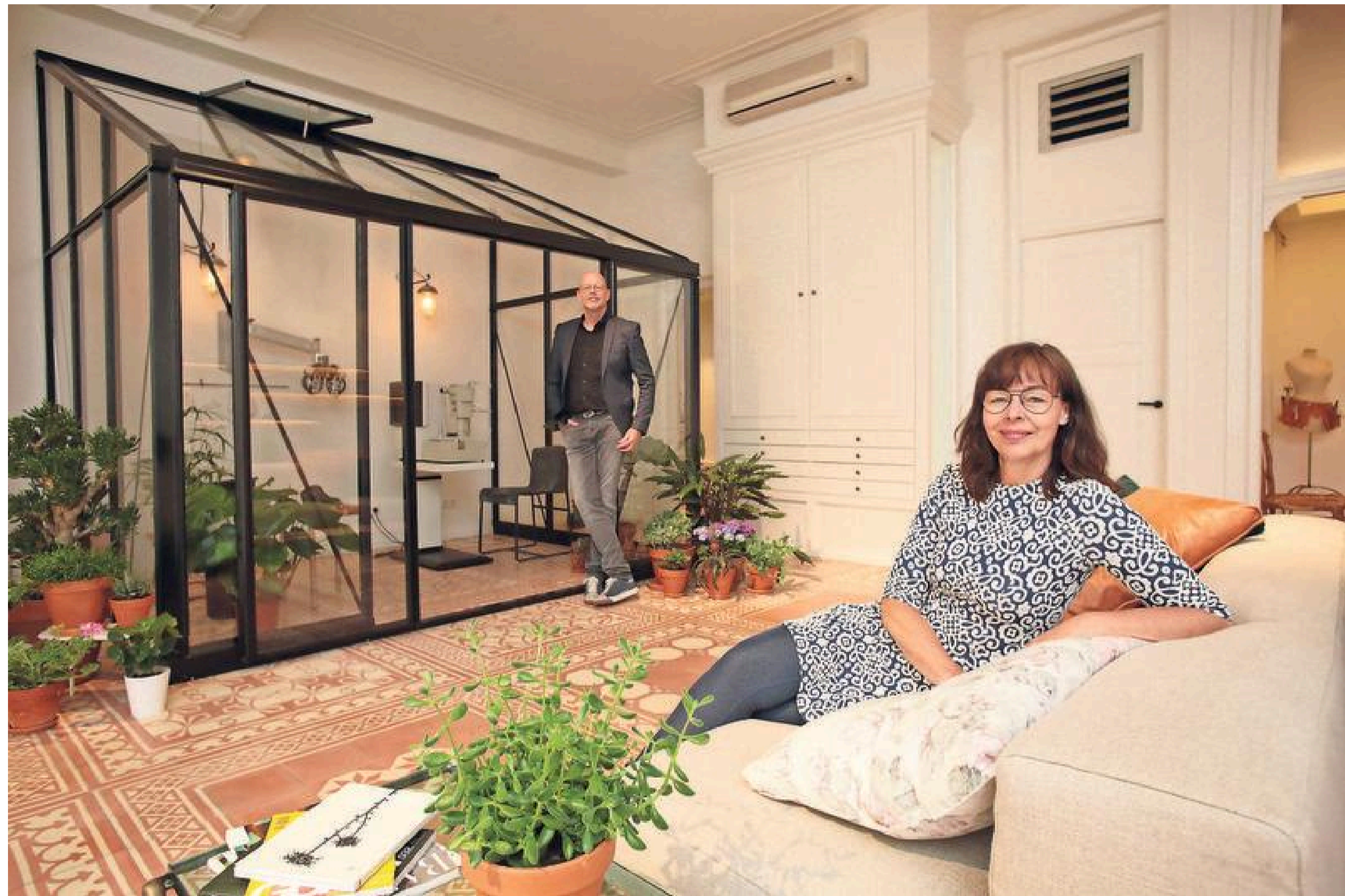
Ogen worden bij De Oogkas opgemeten in een plantenkas.

Dick Moby bijvoorbeeld, een Nederlands merk van twee hele leuke Amsterdamse vrienden. Surfers die baalden van al het plastic dat ze in zee zagen drijven. Zouden we daar geen zonnebrillen van kunnen maken? Dat bleek niet haalbaar, maar het bracht ze op het idee om van het restafval van monturen nieuwe brillen te maken. Bij het uittreuzen van monturen blijft er altijd veel kunststof over, weet Kikstra. „De plek waar de glazen komen bijvoorbeeld. Tien procent van de omzet van hun