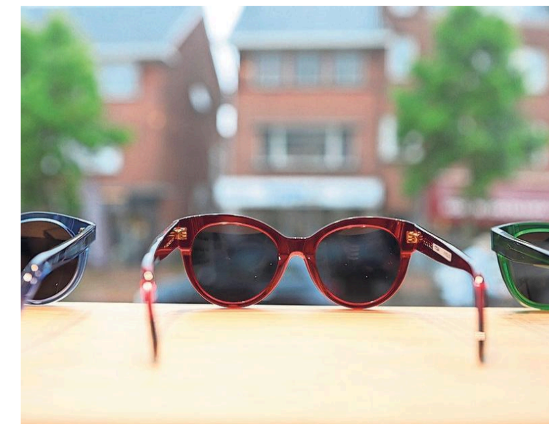
Dick Moby maakt brillen van gerecycled materiaal.