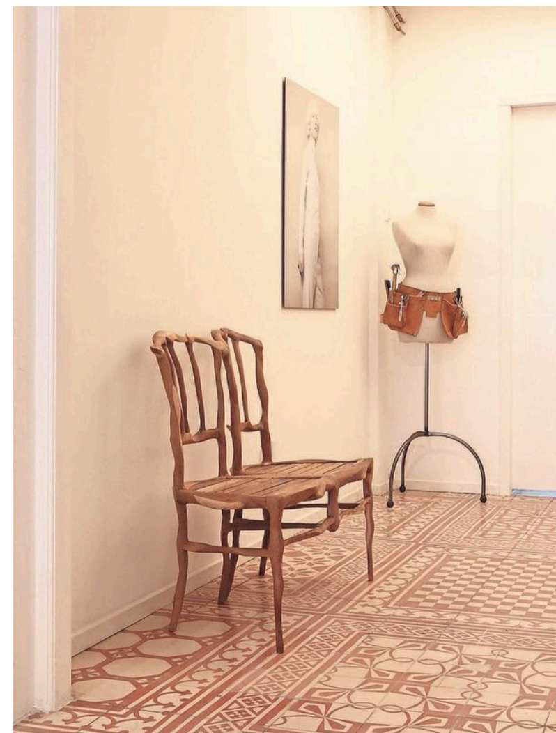
De oude paspop is een herinnering aan Accademia.